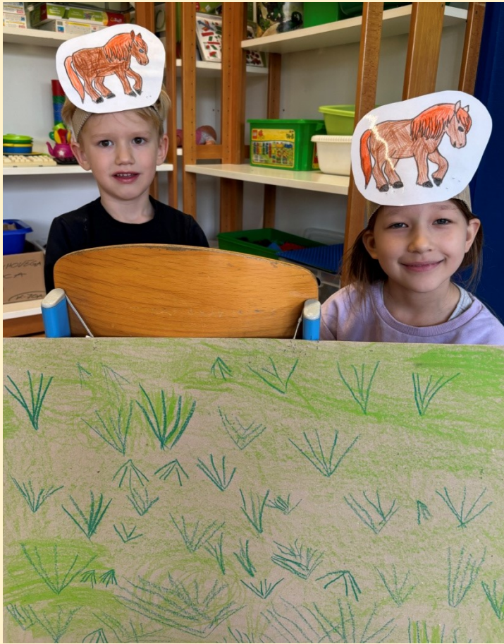
KONJA IN PUJSA...